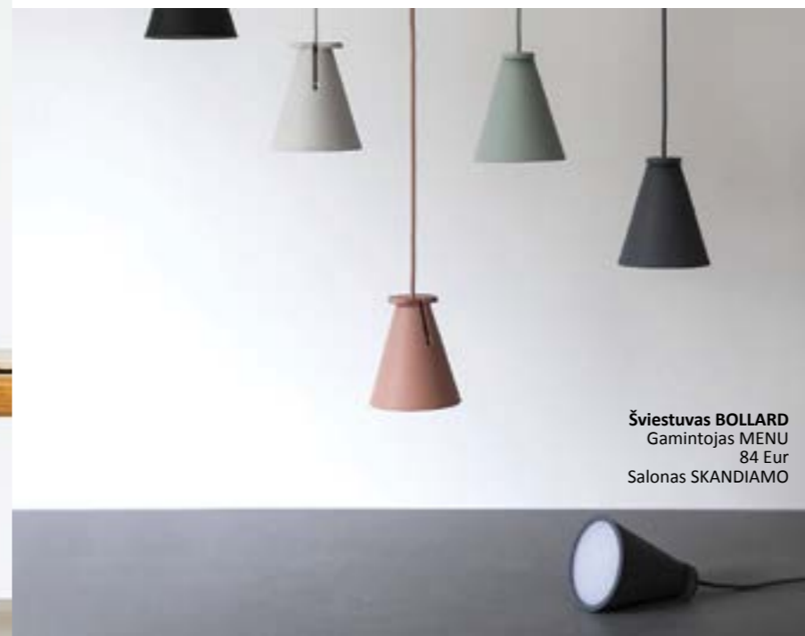
Šviestuvas BOLLARD Gamintojas MENU 84 Eur Salonas SKANDIAMO

Kitas svarbus žingsnis – iš šiandieninio gausaus asortimento išsirinkti šviestuvus, kurie suteiks namams jaukumo, interjerui – išbaigtumo ir net asmeniškumo.