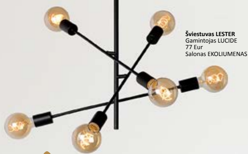
Šviestuvas LESTER Gamintojas LUCIDE 77 Eur Salonas EKOLIUMENAS