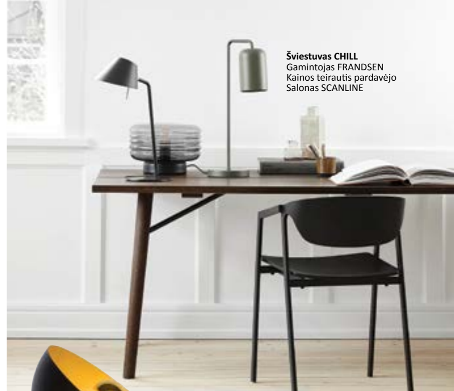
Šviestuvus CHILL Gamintojas FRANSESEN Kainos teirautis pardavėjo Salonas SCANLINE

Šiandien skirtingų formų, dydžių, ryškesnių spalvų, konstrukcijų ir stiliaus šviestuvų įvairovė didelė, todėl nesunku išsirinkti dailius stalinius, kurie ne tik puošia interjerą, bet ir labai funkcionalūs. Korpusas ir gaubtas dažnai gaminami iš metalo, keramikos, medienos, stiklo ar lengvai perdirbamų, ekologiškų medžiagų. ■