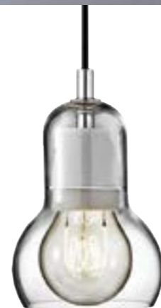
Šviestuvas BULB Gamintojas &TRADITION Kainos teirautis pardavėjo Salonas 4 URBAN SOUL

Pakabinimi šviestuvai yra ne tik pagrindiniai šviesos šaltiniai, bet ir stilingi interjero elementai. Juos renkantis, pirmiausia reikėtų atkreipti dėmesį į patalpos dydį ir aukštį, o tada – į skersmenį, t. y. laido ilgį, gaubto dydį, ar neatrodys per maži. Tokiu atveju galbūt reikėtų kabinti 2–3 didesnius ir 1 mažesnį arba visus tris vienus, bet skirtingų spalvų. Pakabinami šviestuvai apšviečia visą erdvę, puošia ją. Šviestuvus pagal dizainą ir medžiagas reikėtų derinti prie kambario baldų, tekstūrų, interjere vyraujančių spalvų. Šiuo metu populiarieji gaminami iš betono, gipso, metalo, stiklo ir puošiami spalvotųjų metalų detalėmis. Turėkite omenyje, kad skirtingų formų gaubtai ir dengiamosios medžiagos padeda kurti įdomias kompozicijas.