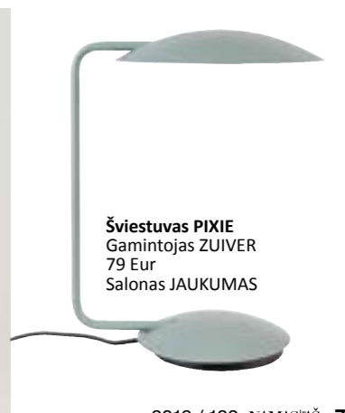
Šviestuvus PIXIE Gamintojas ZUIVER 79 Eur Salonas JAUKUMAS