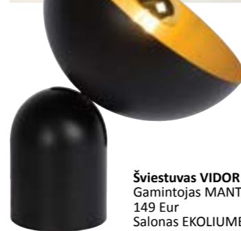
Šviestuvus VIDOR Gamintojas MANTRA 149 Eur Salonas EKOLIUMENAS