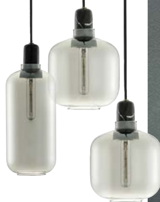
Šviestuvas AMP Gamintojas NORMAN COPENHAGEN Nuo 135 Eur Salonas SKANDIAMO