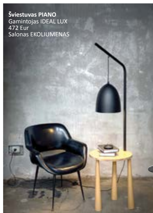
Šviestuvus PIANO Gamintojas IDEAL LUX 472 Eur Salonas EKOLIUMENAS