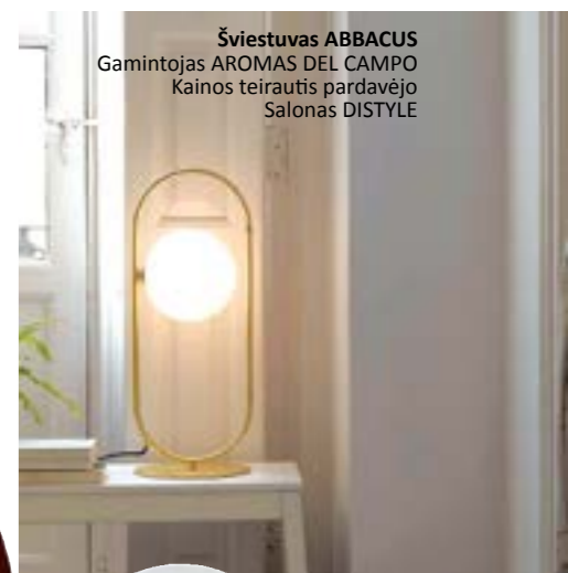
Šviestuvus ABBACUS Gamintojas AROMAS DEL CAMPO Kainos teirautis pardavėjo Salonas DISTYLE