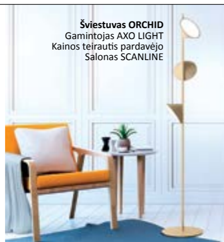
Šviestuvus ORCHID Gamintojas AXO LIGHT Kainos teirautis pardavėjo Salonas SCANLINE

Unikalaus dizaino toršerai pagyvina gyvenamąją erdvę ir suteikia dar daugiau jaukumo. Jie naudingi funkciškai, nes gali apšviesti reikiamas zonas (išskirti tam tikrus baldus, detales) arba tiesiog skaitomą knygą, vartomą žurnalą. Tokie šviesos šaltiniai dažniausiai naudojami svetainėje, bet tinka ir darbo kambariui ar miegamajam. Toršerai apšviečia nedidelį kambario plotą ir geriausiai atrodo pastatyti prie sofos, pufo ar fotelio. Jie yra subtilių, grakščių linijų, įvairių formų gaubtais, su atraminiu šoniniu staliuku – tai ypač patogus svetainėje. Dažnai galima keisti apšvietimo kampą, rakursą (kraipant gaubtą) ir reguliuoti šviestuvo aukštį. Atidžiai parinktas toršeras bet kuriam interjerui suteikia žavesio.