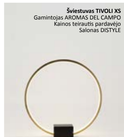
Šviestuvus TIVOLI XS Gamintojas AROMAS DEL CAMPO Kainos teirautis pardavėjo Salonas DISTYLE