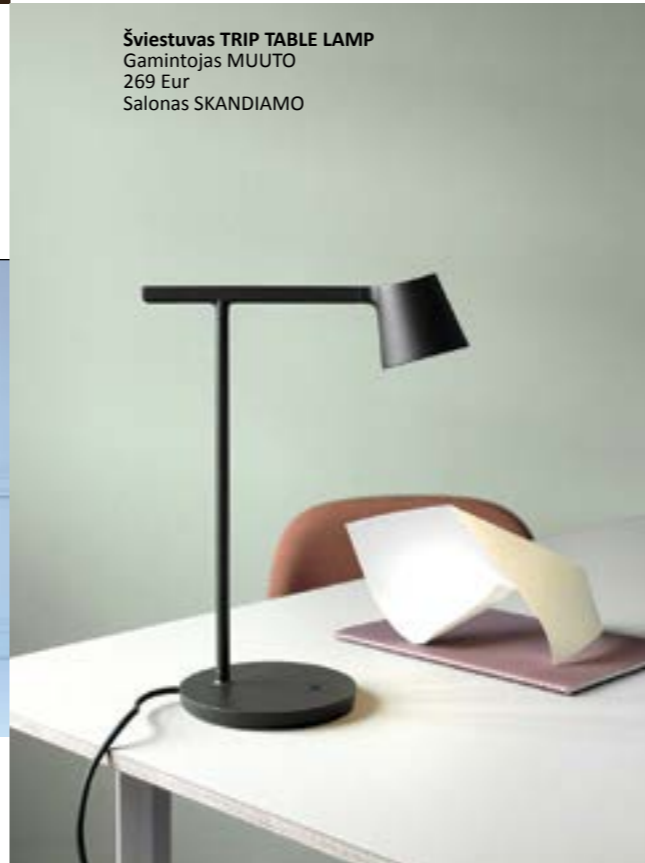
Šviestuvus TRIP TABLE LAMP Gamintojas MUUTO 269 Eur Salonas SKANDIAMO