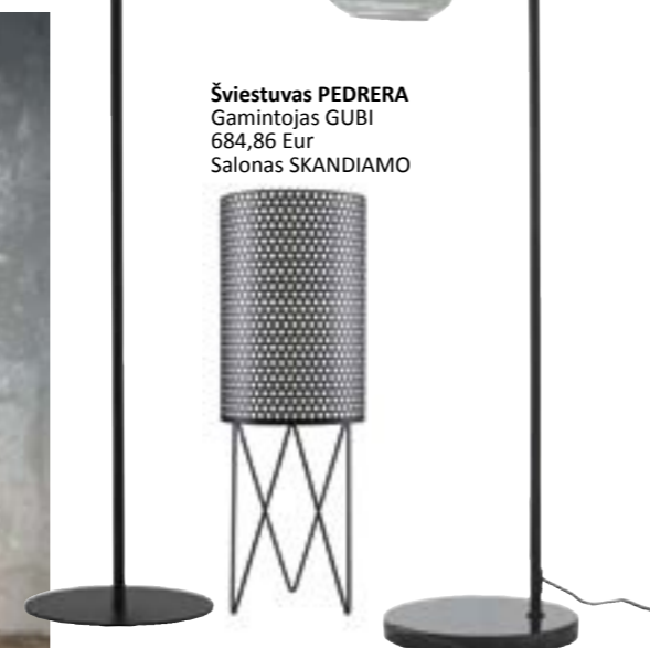
Šviestuvus PEDRERA Gamintojas GUBI 684,86 Eur Salonas SKANDIAMO