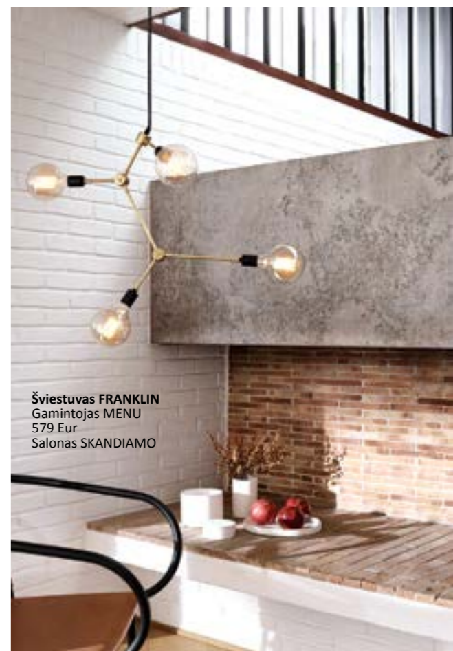
Šviestuvas FRANKLIN Gamintojas MENU 579 Eur Salonas SKANDIAMO

Pakabinimi šviestuvai yra ne tik pagrindiniai šviesos šaltiniai, bet ir stilingi interjero elementai. Juos renkantis, pirmiausia reikėtų atkreipti dėmesį į patalpos dydį ir aukštį, o tada – į skersmenį, t. y. laido ilgį, gaubto dydį, ar neatrodys per maži. Tokiu atveju galbūt reikėtų kabinti 2–3 didesnius ir 1 mažesnį arba visus tris vienus, bet skirtingų spalvų. Pakabinami šviestuvai apšviečia visą erdvę, puošia ją. Šviestuvus pagal dizainą ir medžiagas reikėtų derinti prie kambario baldų, tekstūrų, interjere vyraujančių spalvų. Šiuo metu populiarieji gaminami iš betono, gipso, metalo, stiklo ir puošiami spalvotųjų metalų detalėmis. Turėkite omenyje, kad skirtingų formų gaubtai ir dengiamosios medžiagos padeda kurti įdomias kompozicijas.