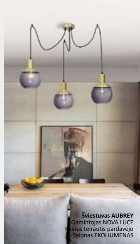
Šviestuvas AUBREY Gamintojas NOVA LUCE Kainos teirautis pardavėjo Salonas EKOLIUMENAS