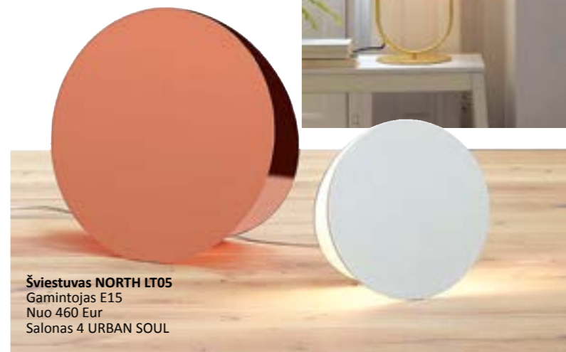
Šviestuvus NORTH LT05 Gamintojas E15 Nuo 460 Eur Salonas 4 URBAN SOUL