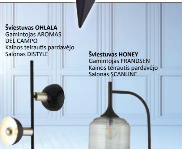
Šviestuvus OHLALA Gamintojas AROMAS DEL CAMPO Kainos teirautis pardavėjo Salonas DISTYLE