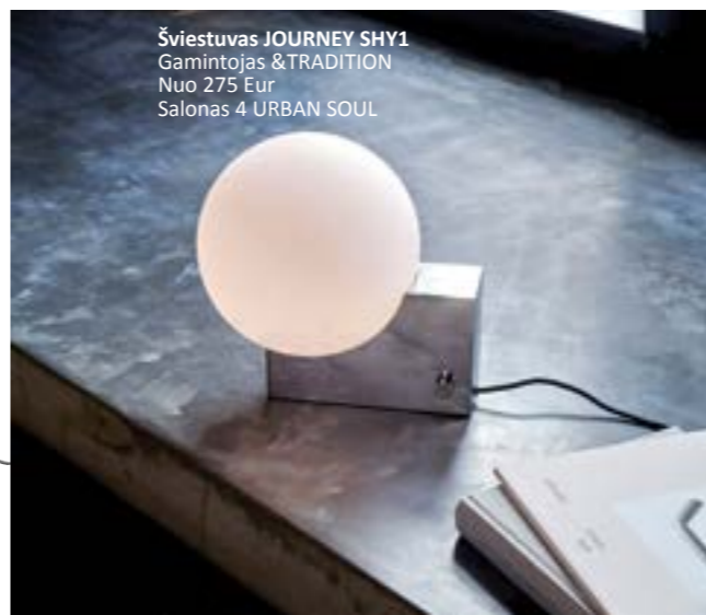
Šviestuvus JOURNEY SHY1 Gamintojas &TRADITION Nuo 275 Eur Salonas 4 URBAN SOUL